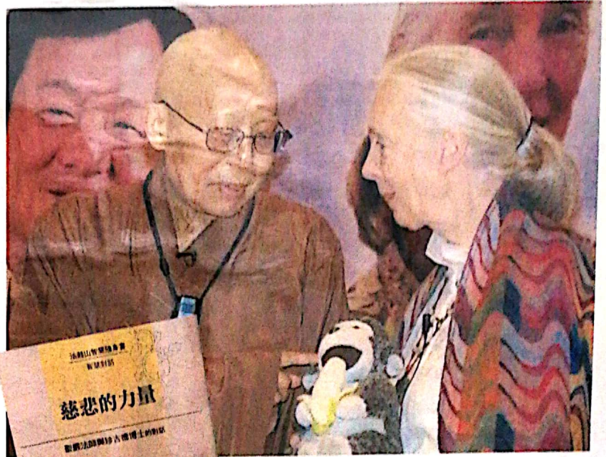
↑林忠彪感恩地说，圣严法师与珍古德博士是影响至他生命至深的两个人物。

对话会的前一夜，林忠彪完全陷入无眠的状态，并且比过去任何一场主持任务，来得认真进行准备功夫，“眼睁睁睡不着，精神抖擞等待重要时刻来临！”他声称，自己从未有过这种渴望遇见偶像的状态。