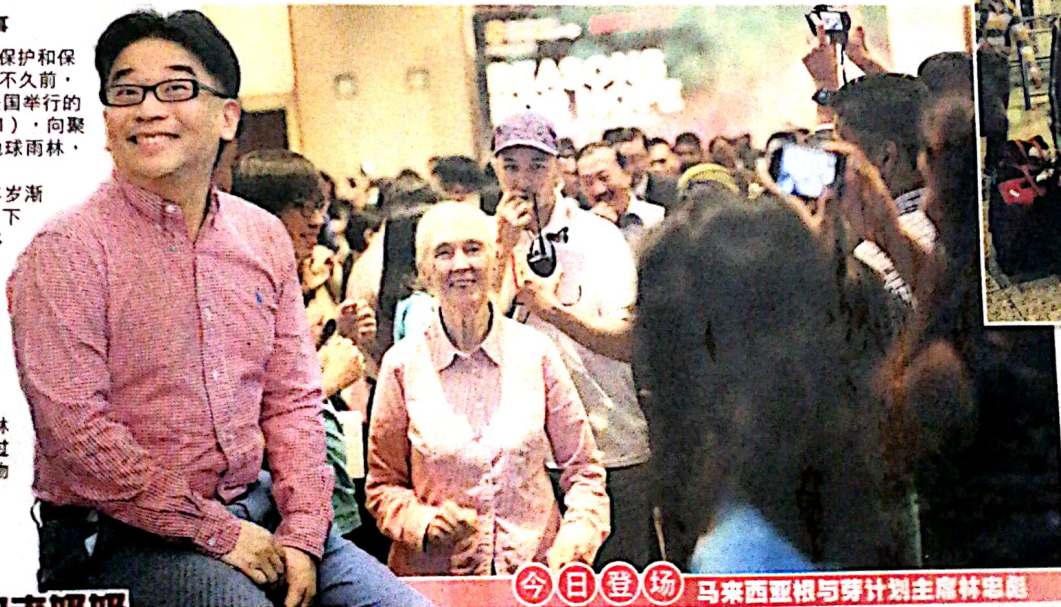
↑ 珍古德博士轻松自在地拉着两大行李箱走出机场。

至于与企业家会面的用意，珍古德深信，企业家足以影响一个国家，只要改变他们就等同于改变一个国家。在出席巴黎气候峰会接受媒体访问时，珍古德就提到金钱利益与保护雨林之间的拉扯，说明企业家的责任与良心之于国家的重要。